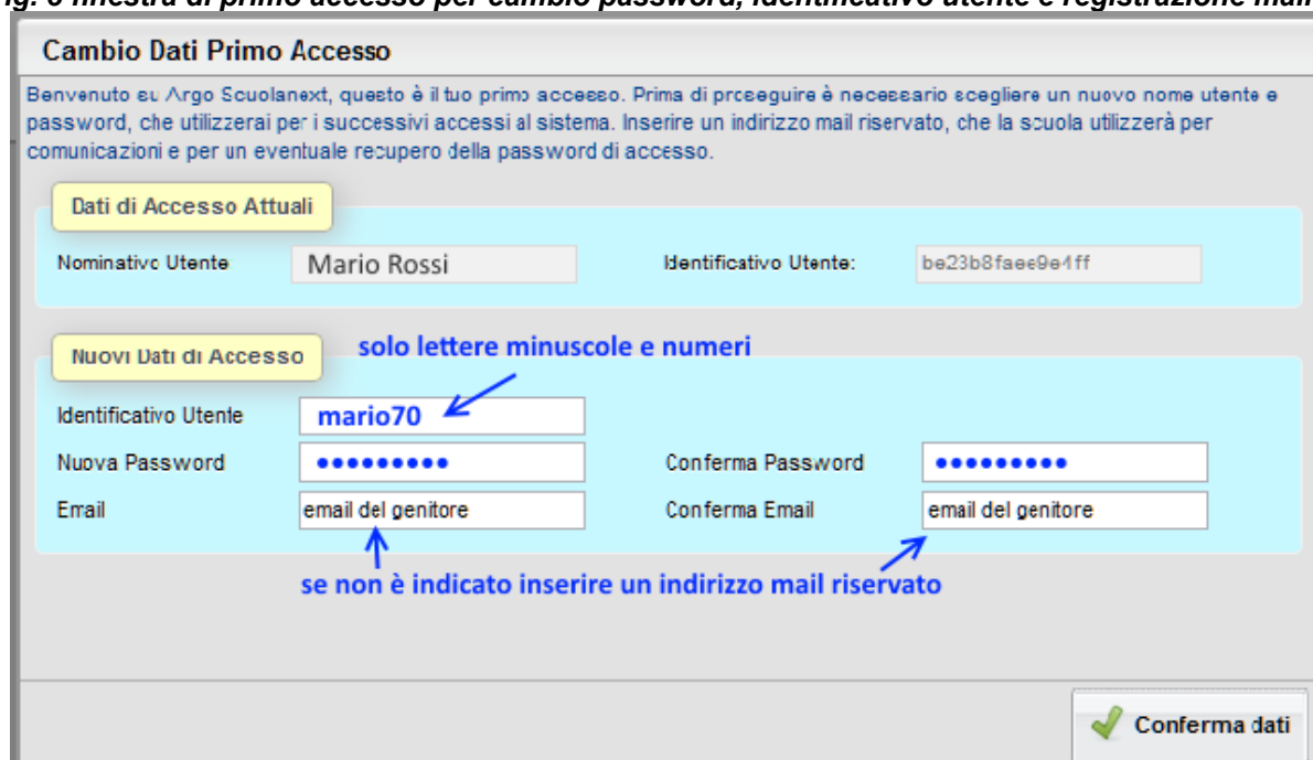
Fig. 3 finestra di primo accesso per cambio password, identificativo utente e registrazione mail.

Dopo aver digitato tutti i dati richiesti, cliccare su " Conferma dati ", a questo punto il sistema avviserà dell'avvenuta registrazione dei dati e provvederà ad inviare una mail di promemoria al vostro indirizzo e.mail.