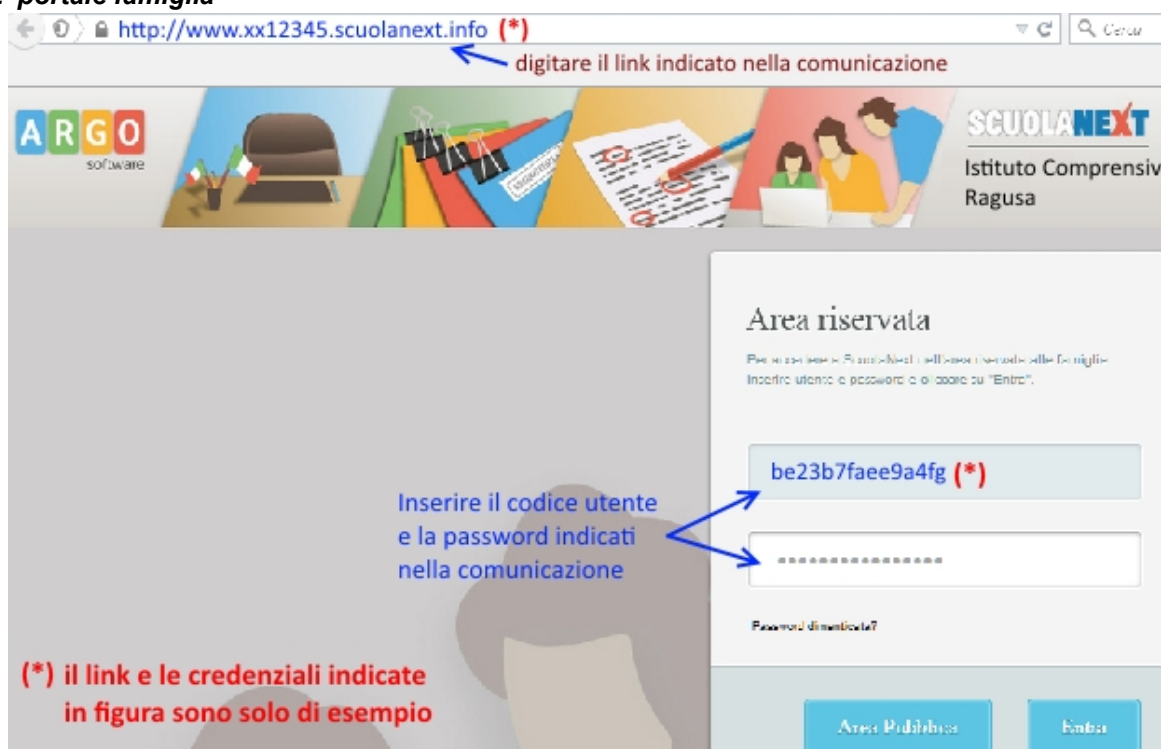
Fig. 2 portale famiglia

Basta avere un pc collegato ad internet, aprire il browser di navigazione ( consigliati mozilla firefox e google chrome ) e digitare o incollare il link indicato nella comunicazione.